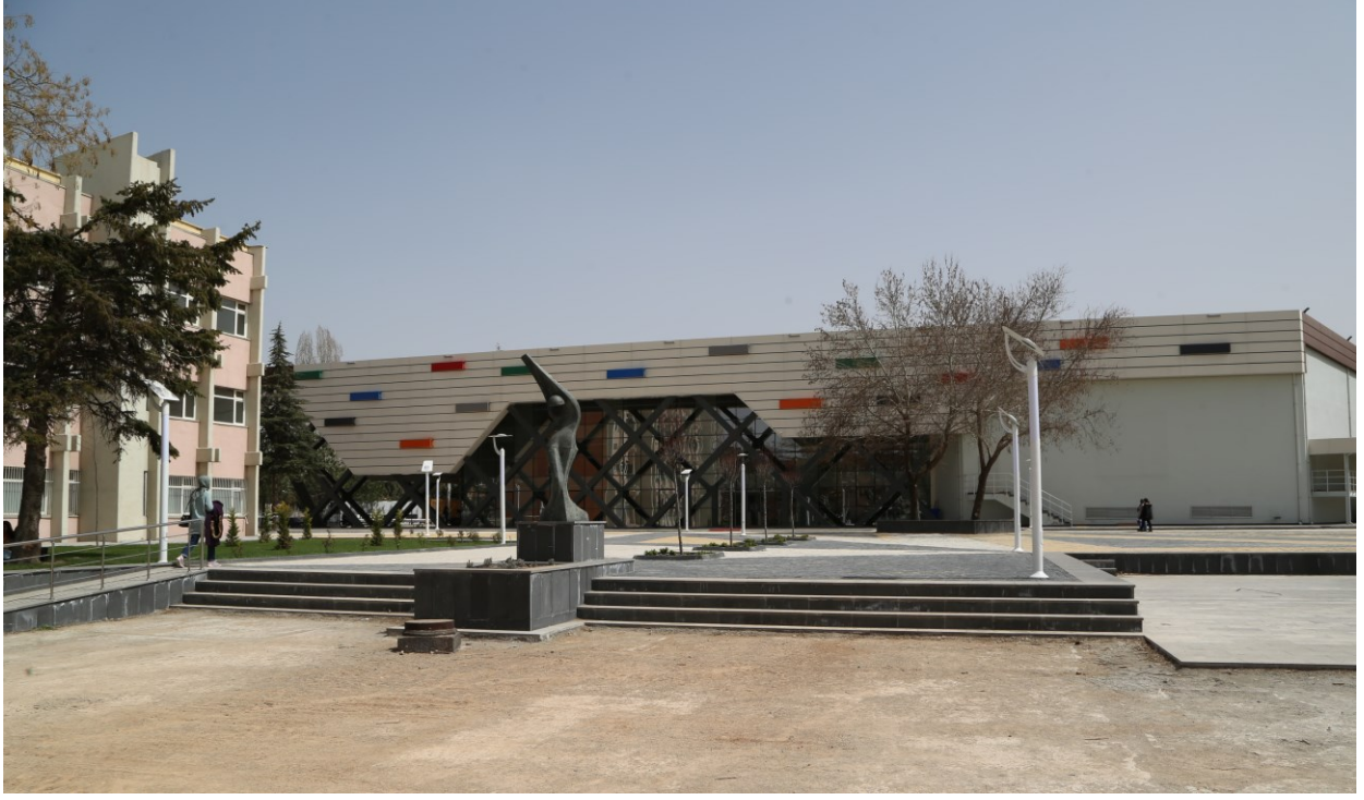
Tıp Fakültesi Derslikleri