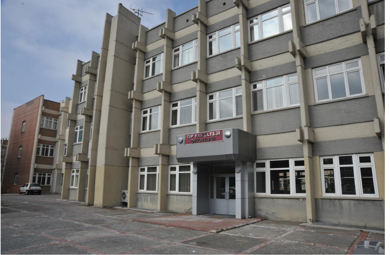
Tıp Fakültesi İdari Binası