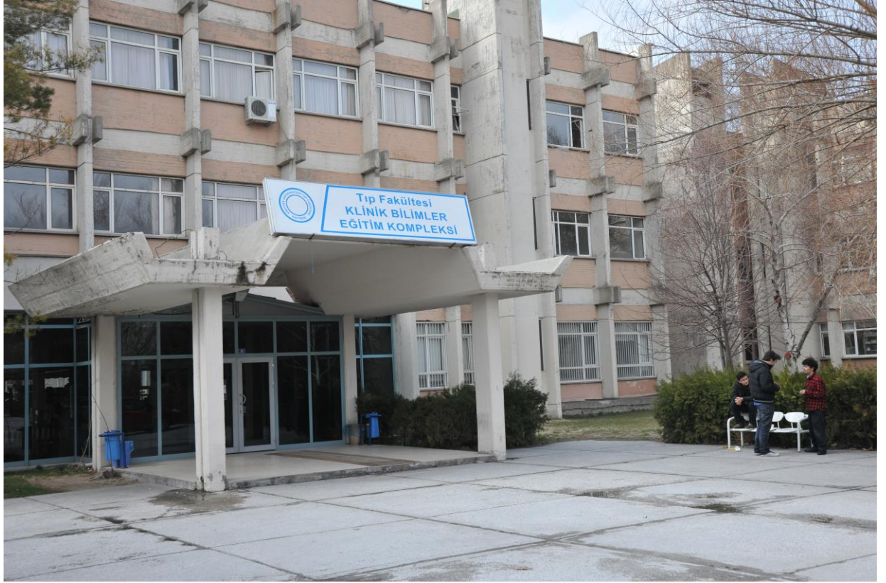
Klinik Bilimler Eğitim Kompleksi