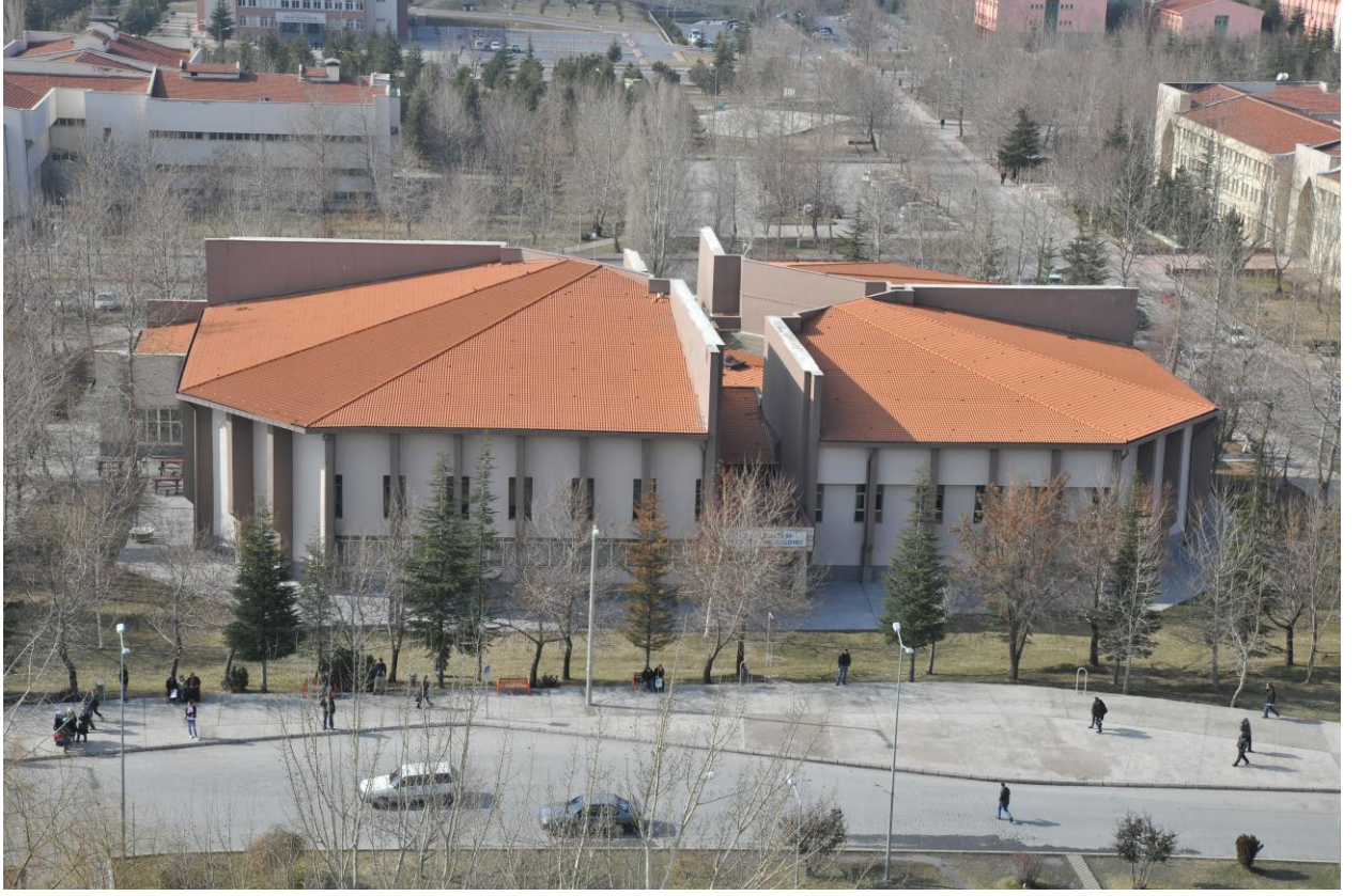
Merkezi Derslikler ve Konferans Salonu